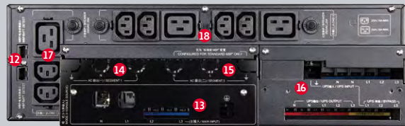
PT15/20KS标准版维修旁路模块接口